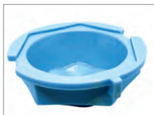
Vaschetta porta coppette