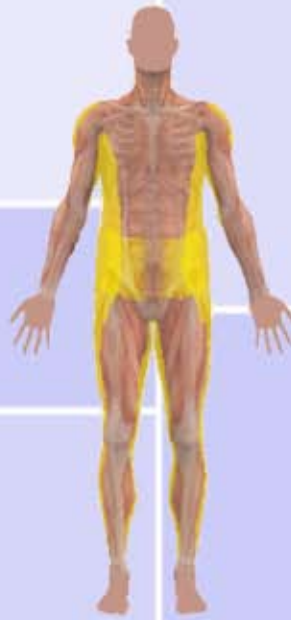
Composizione corporea attuale

gamba a sinistra: Grasso: 14.8 % Grasso: 2.0 kg FFM: 11.8 kg