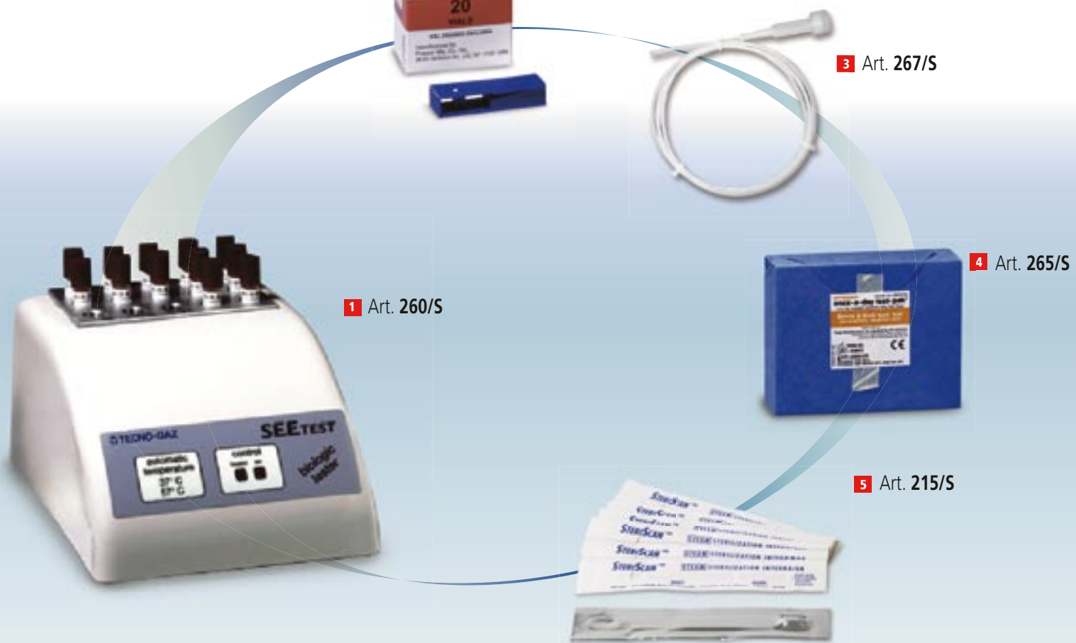
1 Art. 260/S