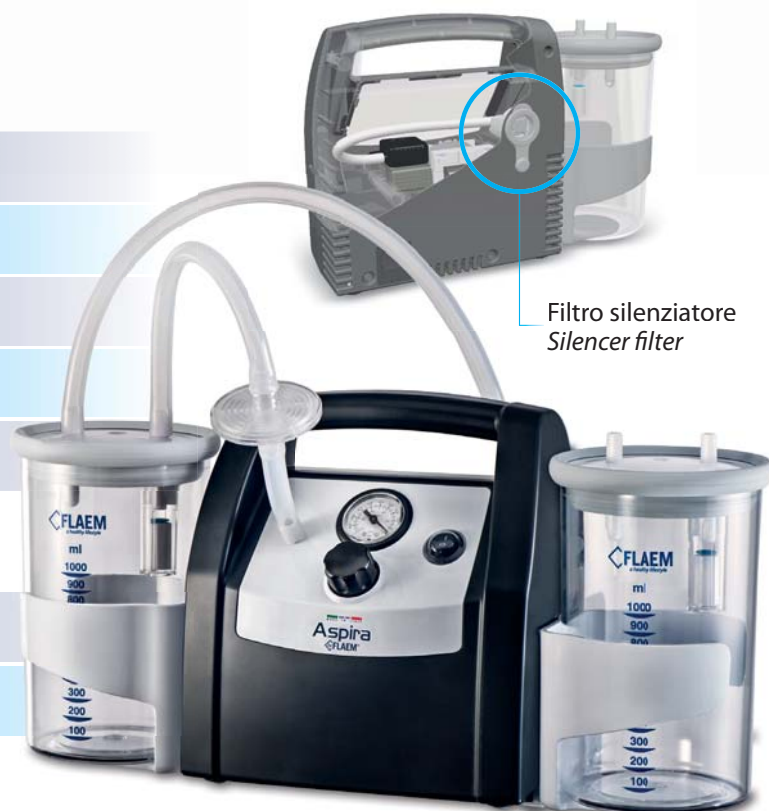
Filtro silenziatore Silencer filter

Patented Product and PCT International Patent Pending