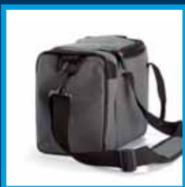
Borsa da trasporto (opzionale) Carrying bag (optional)

COMANDO MANUALE DEL FLUSSO ASPIRANTE : l'aspiratore ASPIRA è dotato del sistema brevettato Flaem ASPICOMFORT (vedi schema in fig.) che permette una regolazione fine del potere aspirante dell'apparecchio; in altre parole il medico può regolare con alta precisione l'effetto dell'aspirazione sul paziente, ottenendo così un'applicazione nel massimo confort del paziente stesso.