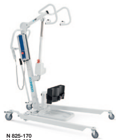
N 825-170 N 825-200