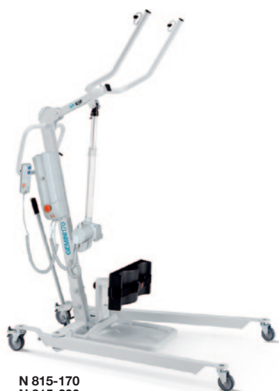
N 815-170 N 815-200