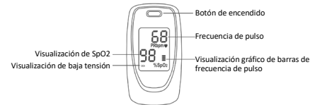
Figura 2. Vista frontal